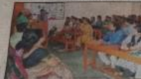
एसएस खन्ना डिग्री कालेज में 'हुनर एवं स्वावलम्बन' शीष्मकालीन कार्यशाला

सहारा न्यूट ग्रुपो प्रयागराज। श्रीष्मकालीन अवकाश के दौरान छात्राओं को हुनरमंद बनाने के उद्देश्य से एसएस खन्ना महिला महाविद्यालय में हुनर एवं स्वावलम्बन कार्यशाला शुरू की गई है।