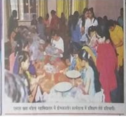
एसएस खन्ना महिला महाविद्यालय में हुनर एवं स्वावलम्बन कार्यशाला में छात्राओं की प्रतिक्रिया।

श्रीष्मकालीन अवकाश में छात्राओं को हुनरमंद बनाने के उद्देश्य से एसएस खन्ना महिला महाविद्यालय में हुनर एवं स्वावलम्बन कार्यशाला शुरू की गई है। इस कार्यक्रम में ८० प्रशिक्षार्थी भाग ले रही हैं। प्रशिक्षण कार्यक्रम में छात्राओं को हुनर एवं स्वावलम्बन के अनेक पहलुओं को सिखाया जा रहा है।